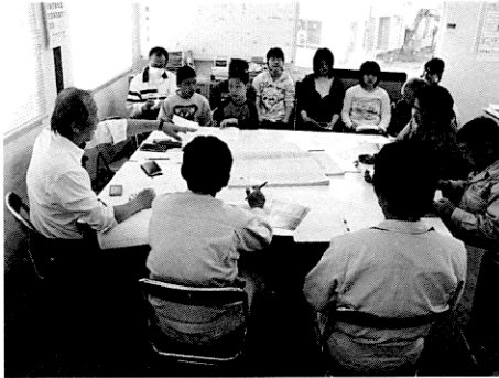
写真4 定例会議の様子