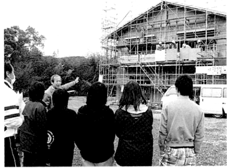
写真5 外壁の色彩決定の様子

棟は星空，男子棟はクローバー模様と決定。ドアの取手や扉の色，手摺の色，便器や洗面器の色，足洗いのタイルの色等細かなところまで意見を聞き，丁寧に子ども達の声落とし込んでいった。