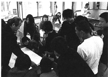
写真2 平面図・立面図の検討