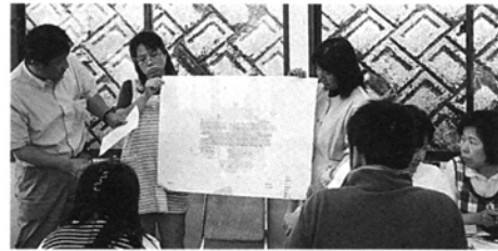
写真1 ワークショップの光景