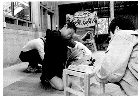
写真6 椅子の製作風景

空っぽであった中庭には，皆で草花を植えた。あえて自分たちで植えることで，共に育ちゆく中庭とした。